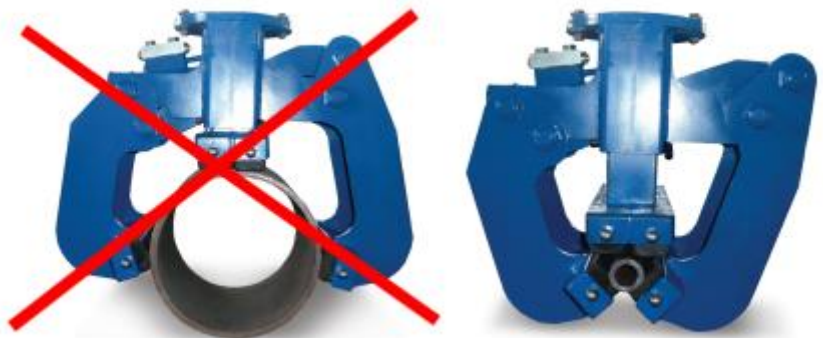
Fout!!! niet voldoende grip Juist!!! Voldoende grip

Zorg dat de grijper voldoende om de buis pakt zodat deze er nimmer uit kan vallen!! Zie onder